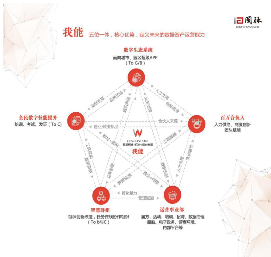
图 1. 五位一体战略图

以数据治理架构师为使命，以定义未来为愿景，聚焦“数字生态系统+数字技能提升+百万合伙人+智慧群组+行业运营”五位一体的数据资产运营，拥有数据基因（DATA DNA）、数据母体（DATA MATRIX）、组织数据体系（ODS）、智慧组织赋能平台（IEP）、我能（WECAN）五大系列五十多个模块的软件产品，长期为中国城市、政府、园区和企业提供规划咨询、软件产品、数据服务和平台运营，广泛服务于政府机构、大型企业、协会联盟和金融行业等。